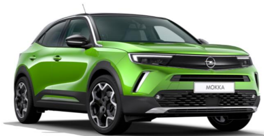
2 Vert Signal