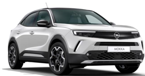
1 Blanc Jade