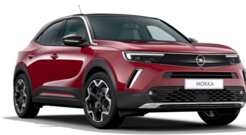
5 Rouge Cardinal