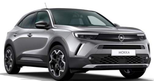
4 Gris Quartz