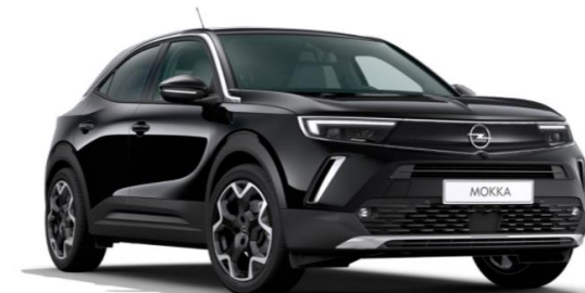
3 Noir Perla Nera