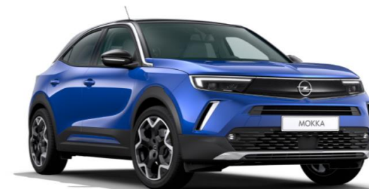
6 Bleu Voltaïque